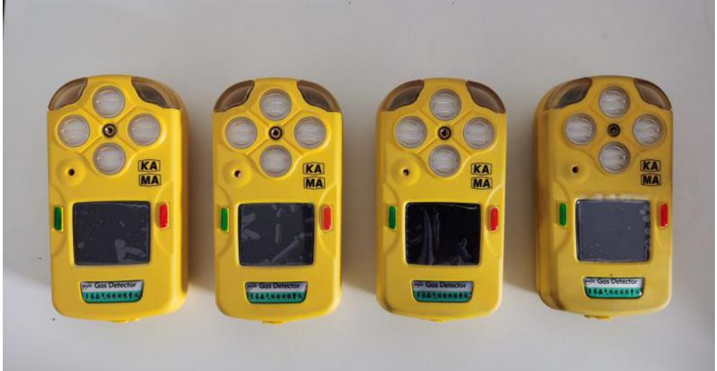
图为 CO、NO 2 、H 2 S、O 2 四合一气体的检测仪(4台)