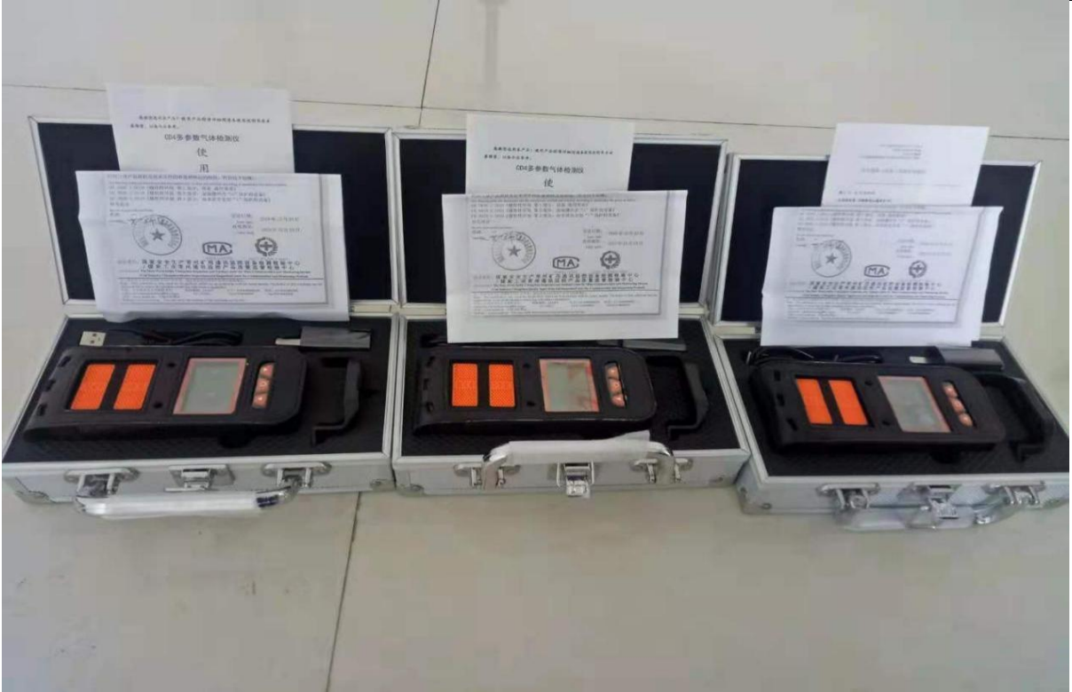
图为 CD4 便携式气体检测报警仪（10 台）