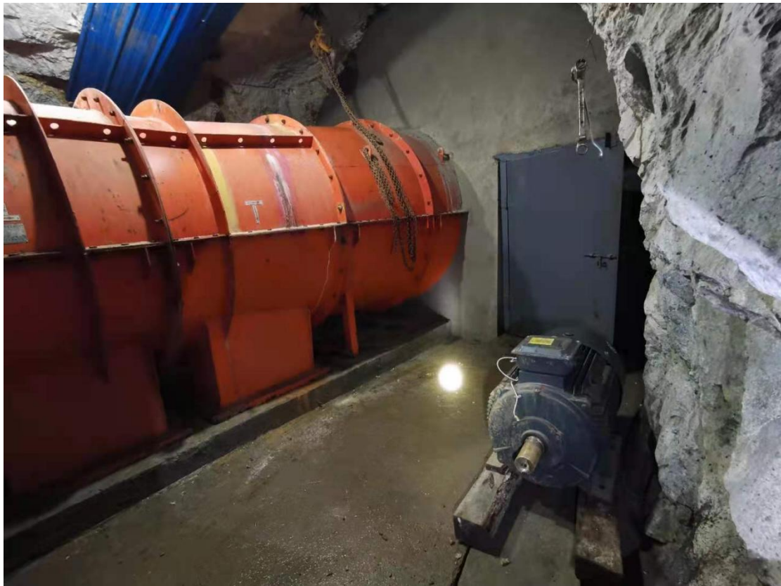
图为：整改后的主通风机备用电机及专用工具