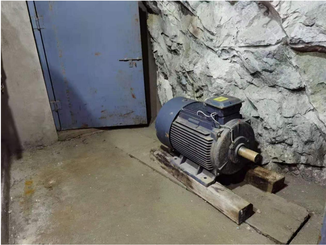
图为：主通风机备用电机

三、安徽九华金峰矿业股份有限公司池州市桐木坑磁铁矿配备的便携式气体检测报警仪只能监测 CO 一种气体，不符合规范要求。