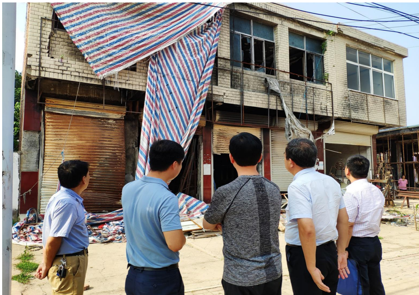
图 4 评估组查看事故现场