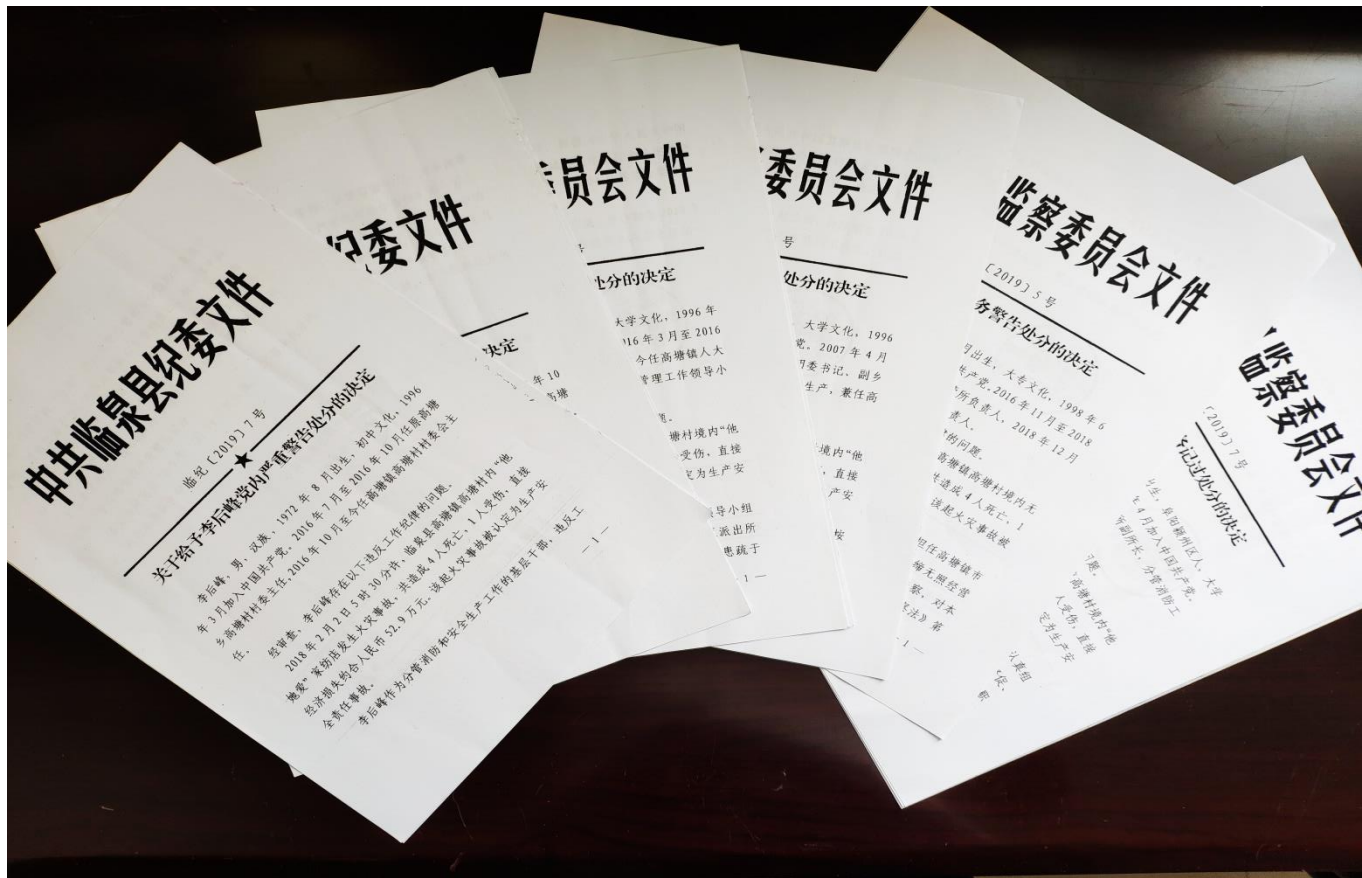
图 2 责任追究落实材料