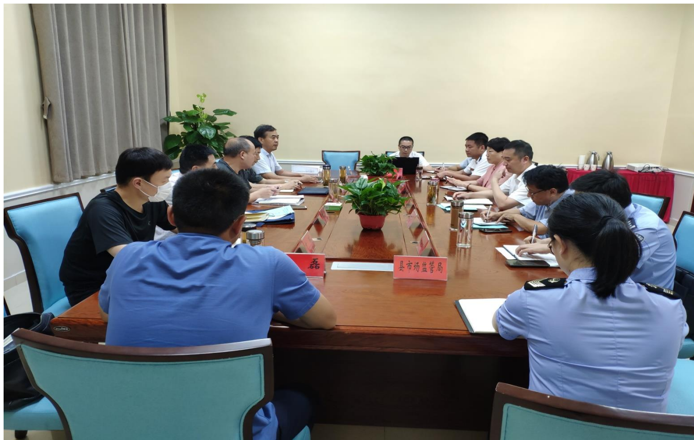
图 1 事故评估组召开评估工作会议